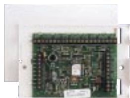
908 : LIM IDIS 8 zones, 8 sorties

Dimensions (h x l x p) : 60 x 120 x 20 mm.