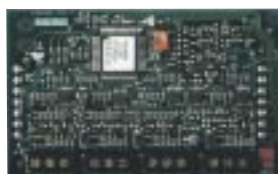
942 : Carte d'extension 4 bus

Carte d'extension enfichable 4 bus pouvant recevoir jusqu'à : 128 zones (128 alarmes + 128 AP associées) + 128 sorties.