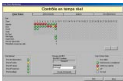
958 : Logiciel de téléchargement

Dimensions (h x l x p) : 15 x 25 x 8 mm.