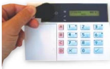
Clavier 9930 et 934