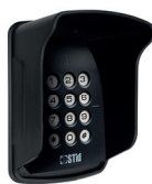
Casquette de protection