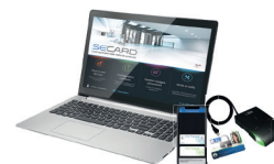
Kit de programmation SECARD et les protocoles SSCP® v1 & v2® et OSDP™

*Nos lecteurs lisent uniquement le numéro de série / UID PICO1444-3B de la puce iCLASS™. Ils ne lisent ni les protections cryptographiques iCLASS™ ni le numéro de série / UID PICO 15693 de HID Global.